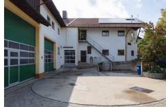
Abbildung 2: Außenansicht des neuen Produktionsstandortes. Dazu wurde ein ehemaliger Schweinebetrieb umgebaut.

Figure 1: The two founders, Thomas Kuehn (l) and Wolfgang Westermeier (r) with a fattening box full of larvae in front of the automatic production line.