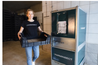
Abbildung 4: Wöchentlich werden in einer klimatisierten Transportbox Jungtiere an die regionalen Mastanlagen geliefert.

Figure 2: The robot empties and fills the mast boxes fully automatically