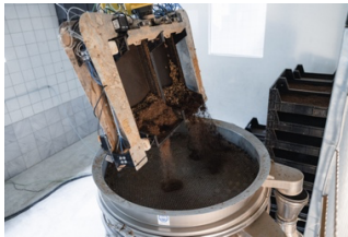
Abbildung 3: Der Roboter entleert und befüllt die Mastkisten vollautomatisch

Figure 3: Exterior view of the new production site. A former pig farm was converted for this purpose.