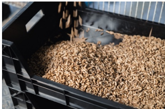
Abbildung 5: Ernte der Larven. Die Larven enthalten bis zu 50 % Protein in der Trockenmasse und sind ein hochwertiges Eiweißfuttermittel.

Figure 4: Young animals are delivered weekly to the regional fattening facilities in an air-conditioned transport box.