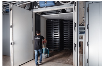
Abbildung 6: Die Mast der Larven erfolgt in Klimakammern welche rund um die Uhr automatisch gesteuert werden.

Figure 5: Harvest of the larvae. The larvae contain up to 50% protein in dry matter and are a high quality protein feed.